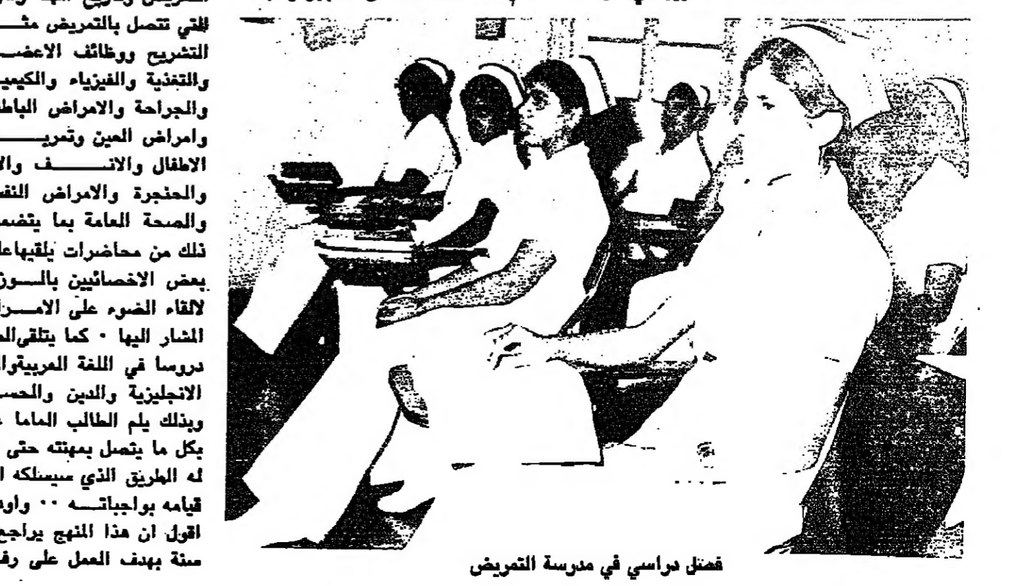
فصل دراسي في مدرسة التمريض

مناقصة رقم ١٤ - ٧٨ يعلم مجلس المناقصات عن طرح مناقصة لتوريد مواد كهربائية للمديرية العامة للكهرباء - وزارة المواصلات . يمكن الحصول على مستندات الشروط والمواصفات من ادارة المناقصات بمحافظة العاصمة مقابل عشر رسالات . يجب ان توضع العروض بصندوق المناقصات بمحافظة العاصمة - مسقط قبل الساعة العاشرة صباح يوم الثلاثاء الموافق ٢١-٢٧-١٩٧٨ . رئيس مجلس المناقصات